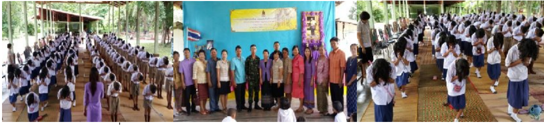
วันที่ ๙ กรกฎาคม ๒๕๕๗ ณ โรงเรียนบ้านหนองคู อำเภอเมืองยโสธร