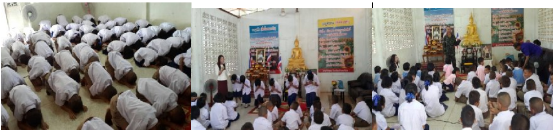
วันที่ ๒๔ กรกฎาคม ๒๕๕๗ ณ โรงเรียนบ้านนาโป่ง อำเภอทรายมูล