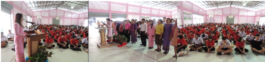
วันที่ ๒๒ กรกฎาคม ๒๕๕๗ ณ โรงเรียนคำเขื่อนแก้วชบุลย์ อำเภอคำเขื่อนแก้ว