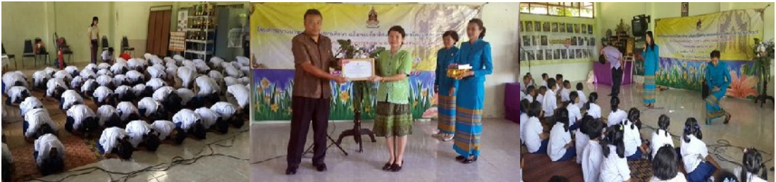
วันที่ ๔ กรกฎาคม ๒๕๕๗ ณ โรงเรียนบ้านโพนงามวิทยาคาร อำเภอไทยเจริญ