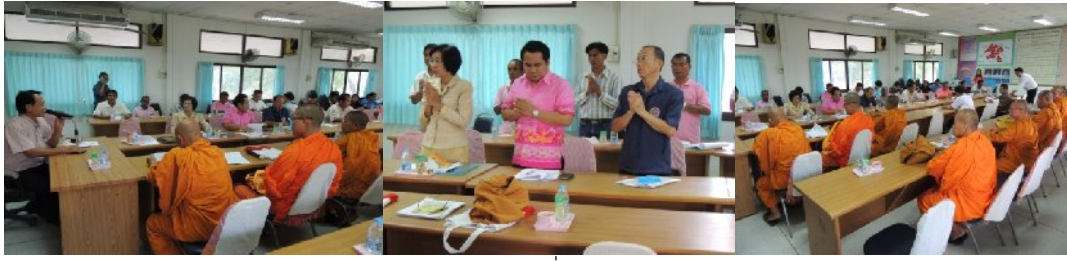
อำเภอคำเขื่อนแก้ว