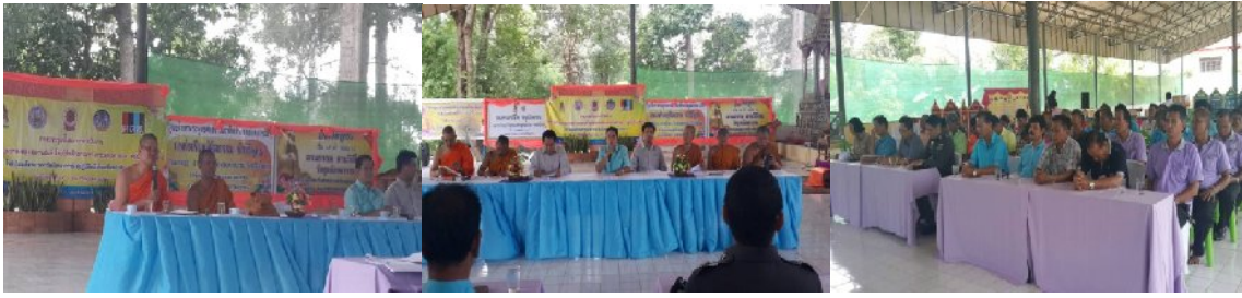
อำเภอมาหาชะชัย