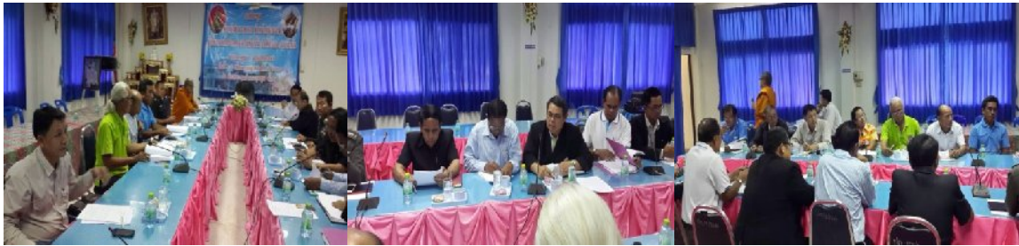
อำเภอกุดชุม