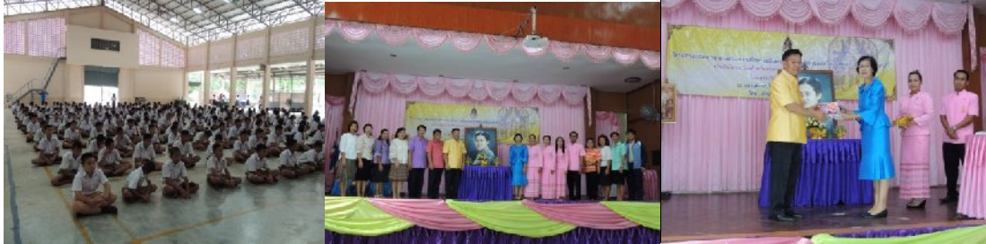
วันที่ ๑๐ กรกฎาคม ๒๕๕๗ ณ โรงเรียนมหาชนะชัยวิทยาคม อำเภอมหาชนะชัย