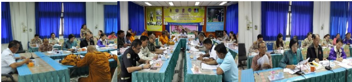
อำเภอเลิงนกา