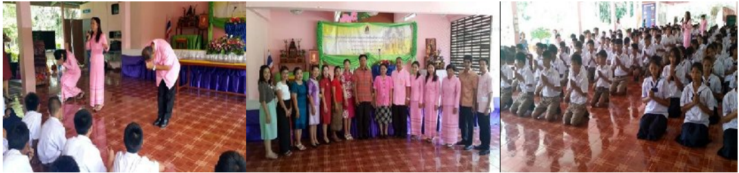
วันที่ ๓ กรกฎาคม ๒๕๕๗ ณ โรงเรียนโพนงามวิทยาคาร อำเภอกุดชุม