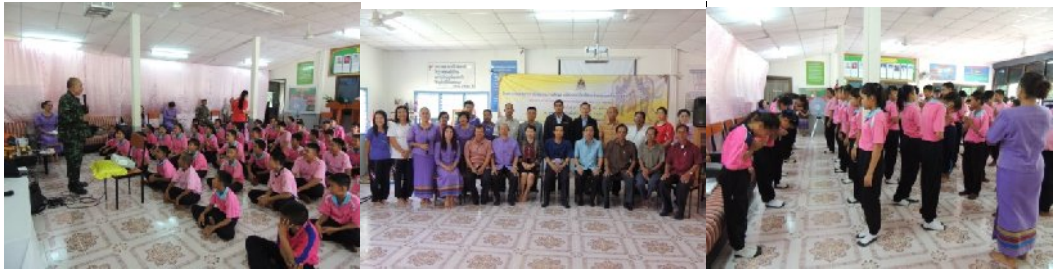
วันที่ ๒ กรกฎาคม ๒๕๕๗ ณ โรงเรียนบ้านสองคร อำเภอกุดชุม

สำนักงานวัฒนธรรมจังหวัดยโสธร บูรณาการร่วมกับโรงเรียนสิงห์สามัคคีวิทยา สังกัดสำนักงานเขตพื้นที่การศึกษามัธยมศึกษา เขต ๒๘ (ศรีสะเกษ - ยโสธร) จัดกิจกรรมอบรมมารยาทไทยสำหรับเด็ก เยาวชน เพื่อสร้างความรู้ ความเข้าใจ ปลุกจิตสำนึกและฝึกปฏิบัติมารยาทไทย แก่เด็ก เยาวชน ให้สามารถนำความรู้ที่ได้ไปปรับใช้ในชีวิตประจำวันได้อย่างเหมาะสม โดยเป็นบทบาทภารกิจ หน้าที่ของสำนักงานวัฒนธรรมจังหวัด ในการส่งเสริม สนับสนุน และเผยแพร่การดำเนินงานด้านวัฒนธรรม ให้กับสังคม และเพื่อเป็นการขยายผลโครงการฝึกอบรมมารยาทไทยในสถานศึกษาให้กว้างขวางมากยิ่งขึ้น เพื่อดำรงความเป็นเอกลักษณ์ ศักดิ์ศรี และความมั่นคงของชาติ รวมทั้งสืบสานวัฒนธรรมไทยที่ดั้งเดิมให้คงอยู่สืบต่อไป