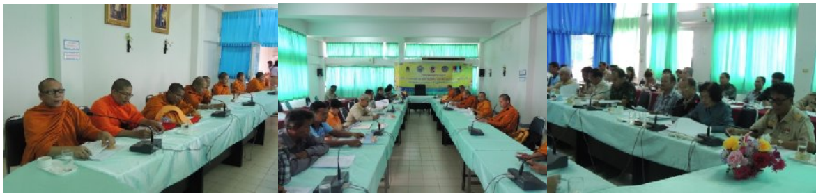
อำเภอไทยเจริญ