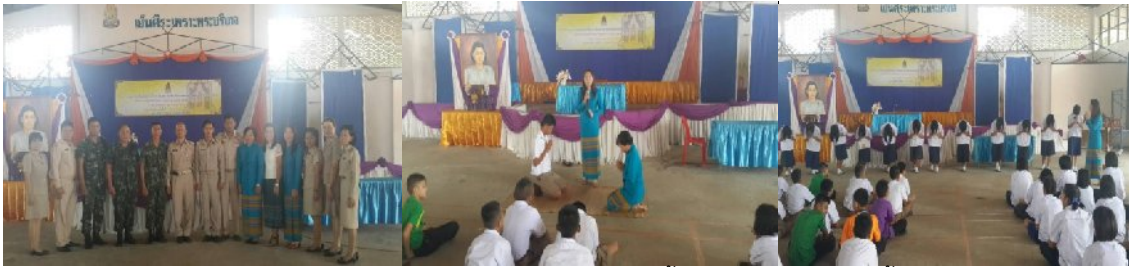
วันที่ ๒๑ กรกฎาคม ๒๕๕๗ ณ โรงเรียนป่าติ้ววิทยาคม อำเภอป่าติ้ว