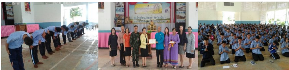
วันที่ ๒๓ กรกฎาคม ๒๕๕๗ ณ โรงเรียนเลิงนกา อำเภอเลิงนกา