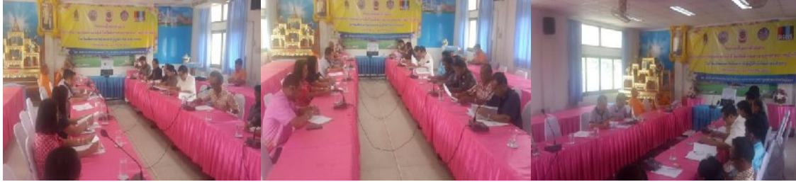
อำเภอทรายมูล