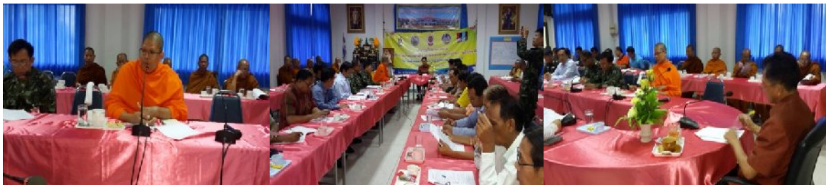
อำเภอค้อวัง