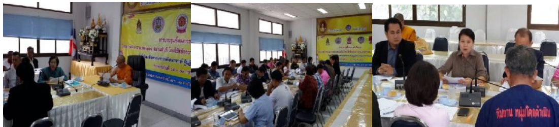
อำเภอเมืองยโสธร

โครงการหมู่บ้านรักษาศีล ๕ : ชาวประชาชนเป็นสุข ในคำริสมเด็จพะมหาพรหมมังคลาจารย์ ผู้ปฏิบัติหน้าที่สมเด็จพะสังฆราช เพื่อให้เด็ก เยาวชน ประชาชน รักษาศีล ๕ โดยเริ่มจากหน่วยเล็กๆ ของครอบครัวรักษาศีล ๕ จนถึงหมู่บ้านรักษาศีล ๕ ให้ครอบคลุมทุกพื้นที่ทั่วประเทศ ซึ่งสอดคล้องกับนโยบายของ คณะรักษาความสงบแห่งชาติ (คสช.) ที่มุ่งเน้นนำมิติศาสนาและวัฒนธรรม สร้างความสุขและความเป็นอยู่ที่ดีขึ้นให้กับคนไทย จากคำริสมเด็จพะมหาพรหมมังคลาจารย์ และนโยบายของ คสช. สำนักงานวัฒนธรรมจังหวัดยโสธร และสำนักงานพระพุทธศาสนาจังหวัดยโสธร ได้ร่วมดำเนินโครงการหมู่บ้านรักษาศีล ๕ รวมทั้งต้องการรณรงค์ให้ทุกภาคส่วน ของสังคม มีส่วนร่วมดำเนินการขยายผลและร่วมนิมนต์ศีล ๕ ไปปฏิบัติในชีวิตประจำวันเพื่อเป็นแบบอย่างที่ดีงามและเพื่อสร้างสังคม ให้เกิดความรัก ความสัจคีปรองดอง อ้ออาทรต่อกัน และอยู่ร่วมกันอย่างมีความสุข