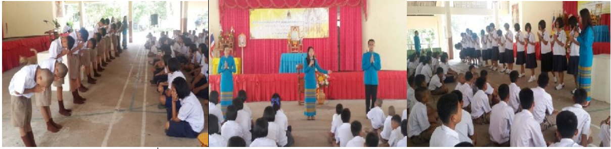
วันที่ ๒๕ กรกฎาคม ๒๕๕๗ ณ โรงเรียนค้อวังวิทยาคม อำเภอค้อวัง

โครงการสร้างความปองครองสมานฉันท์ โดยใช้หลักธรรมทางพระพุทธศาสนา